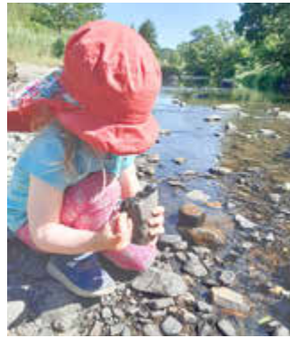
Foto: Bei einem genauen Blick ins Gewässer, kann man vieles entdecken.

Von einigen Tieren wie zum Beispiel dem Biber, sieht man allerdings oft nur die Spuren - Biberdämme oder die unverkennbar angenagten Bäume. Bei den kleineren im Wasser lebenden Tieren, muss man natürlich wissen, wo man „suchen“ muss. Um vor Feinden sicher zu sein, verstecken sich viele Tiere unter großen Steinen. Man kann also einfach einen Stein aus dem Wasser nehmen und sich die Unterseite anschauen. Dort kann man erstaunlich viel Leben entdecken. Und wenn dort jemand kleine „zusammengeklebte“ Steinchen findet, dann sind das nicht nur Steine, sondern man hat das Zuhause einer Köcherfliegenlarve entdeckt. Im Übrigen kann man anhand der Lebewesen im Wasser auch Rückschlüsse daraus ziehen, wie gesund der Bach oder Fluss ist. Wie wär's beim nächsten Spaziergang also mal mit einem genaueren Blick ins Gewässer? Dieser Text entstand in Zusammenarbeit der Fachberaterinnen und Fachberater Gewässer des Landesamtes für Umwelt, Landwirtschaft und Geologie und der unteren Wasserbehörde des Landkreises.